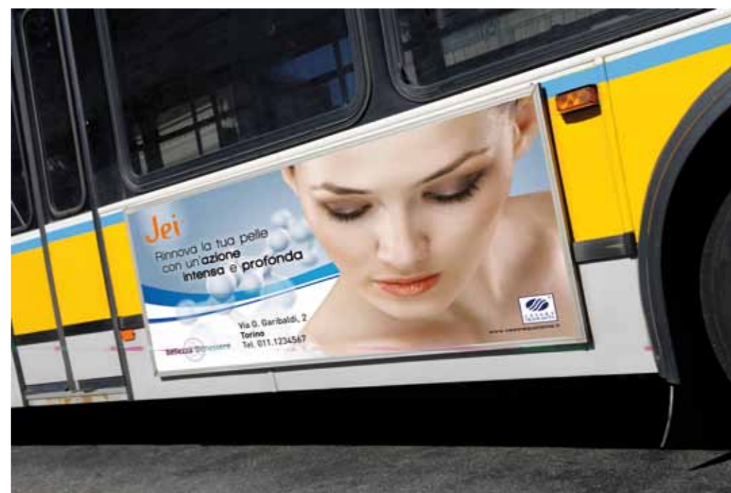
Autofiltramviaria Outdoor poster