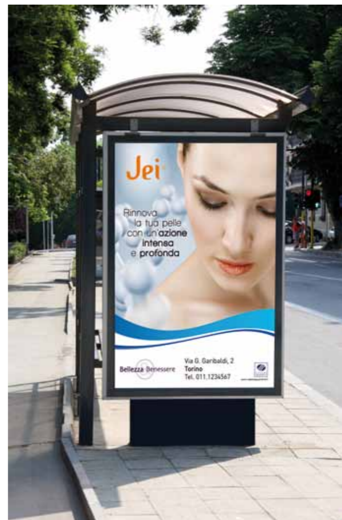
Poster 70x100 Outdoor Poster 70x100

The marketing office can assist you also with publicity campaigns on media with greater diffusion, such as the daily or periodic press, the local radios or television stations, by offering you support in all the strategic and operative publicity planning phases, and by suggesting you promotional projects of considerable interest for the customers and economically remunerative for your activity. Our 20-year experience in the sector of the aesthetics and our strategic vision of the communication world make us a key element of your strategy.