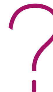
Mailing 10x21 Mailing 10x21